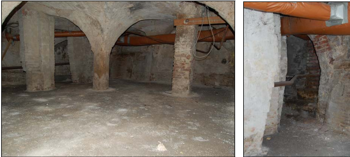
Overzicht van de kelder onder nummer 9. rechts de voormalige toegang naar de straat.