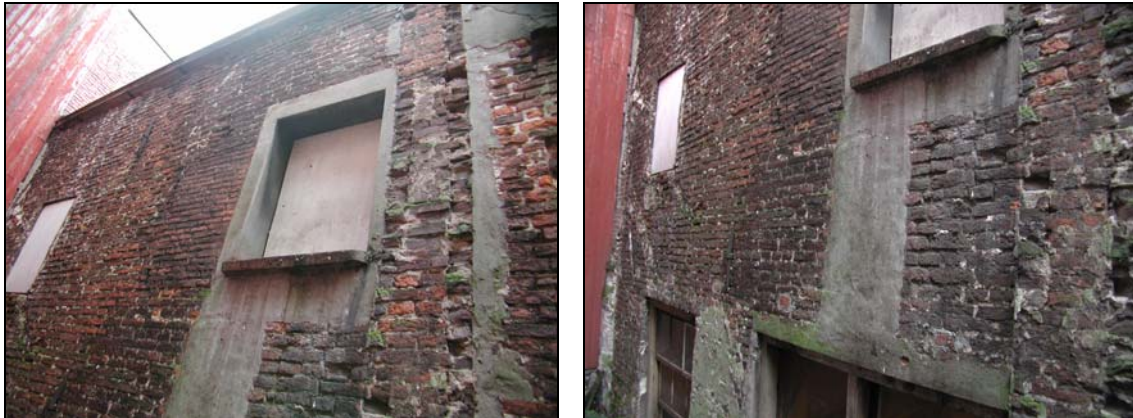
Overzicht van de achtergevel van nummer 9.

De achtergevel is een afgeknotte topgevel met in het midden een zwaar rookkanaal. De verschillende vensters zijn allemaal later in de gevel ingehakt. De 10-lagenmaat van het metselwerk komt overeen met die van de achtergevel van nummer 7. Aan de rechter zijde is een bouwspoor zichtbaar van een afgehakte dwarsmuur.