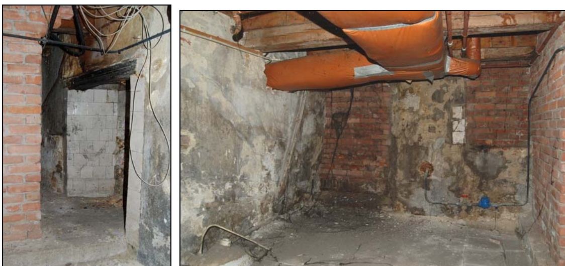
De kelder onder nummer 7; links een betegelde schouw in de linker bouwmuur en rechts de straatgevel met links een dichtgezette toegang en rechts een dichtgemetseld kelderlicht.

Van het linker huis is de gehele plattegrond onderkelderd. Het kelderdek bestaat uit een vrij forse enkelvoudige balklaag, daterend uit de late 17 de of 18 de eeuw. Oorspronkelijk was deze kelder voorzien van een gewelf. In de linker bouwmuur is een met witte tegels afgewerkte schouw aangebracht. Aan de straatzijde zijn grote openingen aangebracht die nu dichtgemetseld zijn; rechts een voormalige keldertoegang en links daarvan één of meerder grote kelderlichten. Dit wijst er op dat de kelder een gebruiksfunctie gehad heeft, waarschijnlijk als keuken.