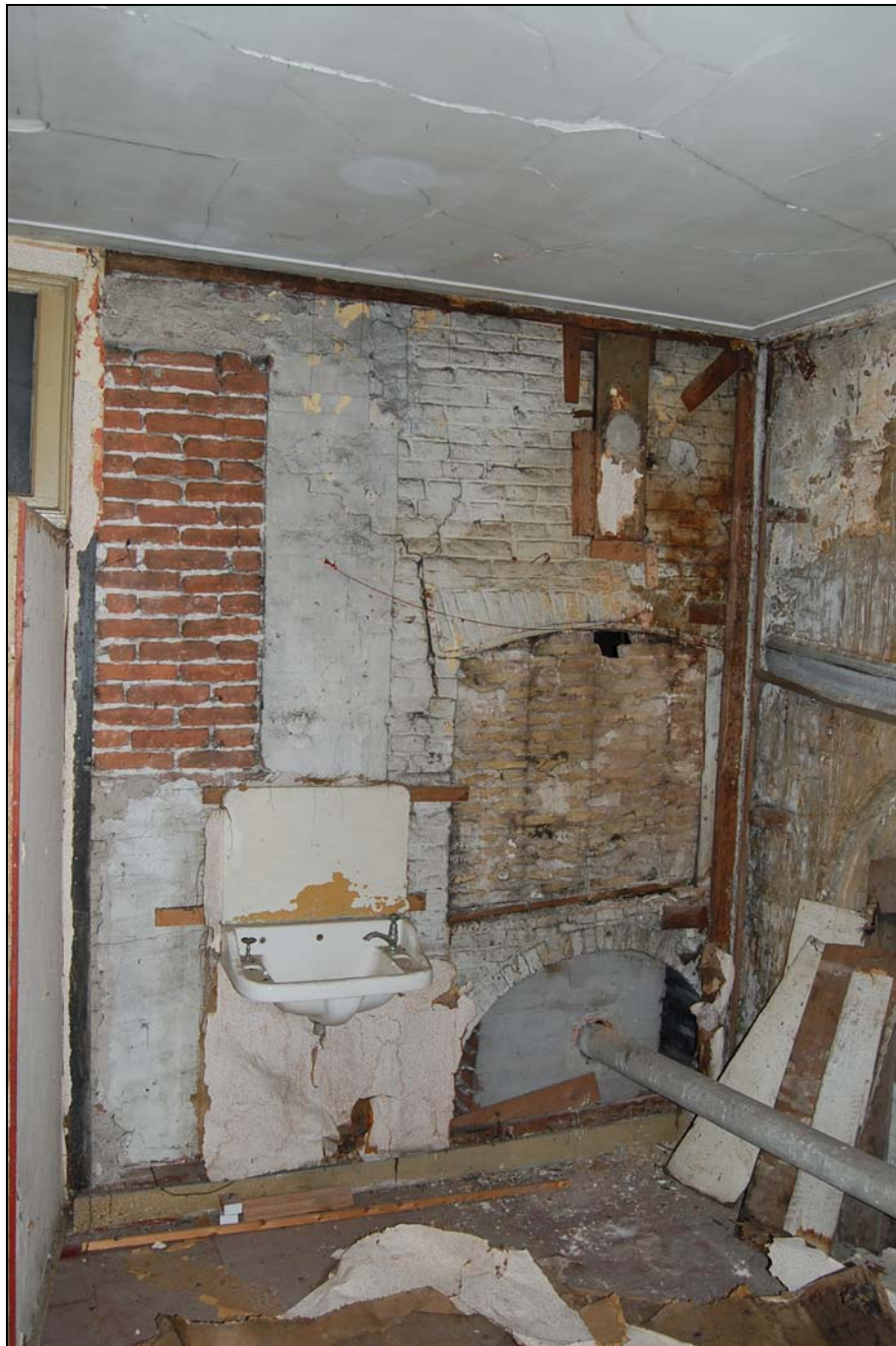
Voorzijde van een op de tweede verdieping van nummer 7 gebouwde ovenconstructie, waarschijnlijk gebruikt door zilversmeden die hier in het derde kwart van de 19 de eeuw als huurders geregistreerd staan.

De oven rust aan de onderzijde op een met secundaire balken aangebrachte raveling op de tweede verdiepingsvloer.