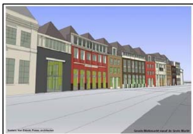
Artist-impression van de gevel aan de Melkmarkt van het te realiseren nieuwbouwplan.

Teneinde alle belangen goed te kunnen afwegen willen Burgemeester en Wethouders voorafgaand aan hun definitieve besluit aanvullend geïnformeerd worden over de bouwhistorische waarde van deze twee panden. Het onderzoek moet met name inzicht geven in hoeverre de casco's nog belangrijke laat-middeleeuwse onderdelen bevatten.