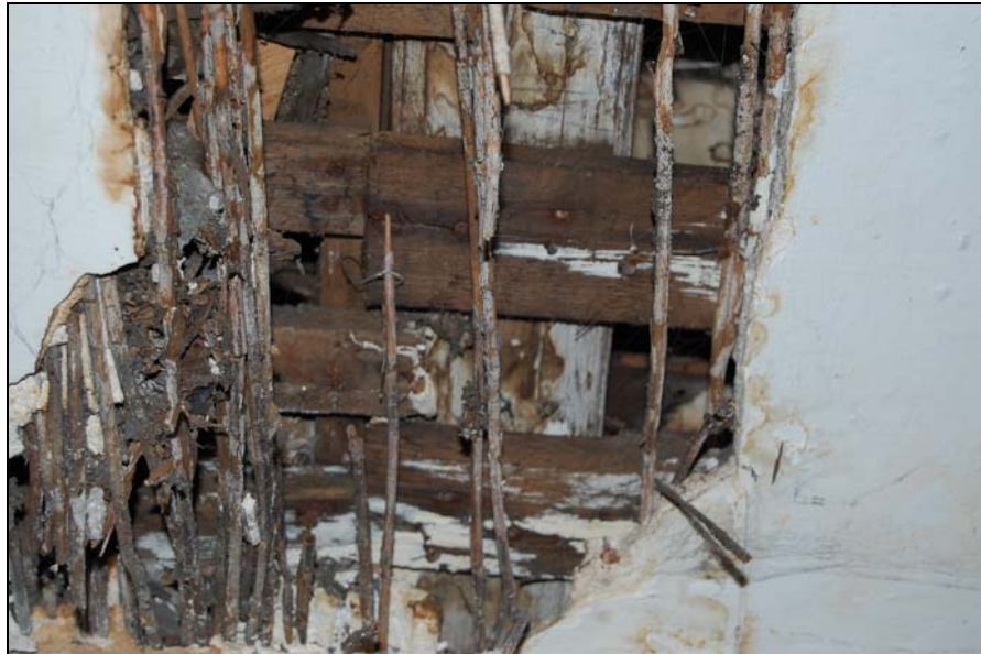
Detail van de onderzijde van de zolderbalklaag met een wit geschilderde balk waar tegen de rietlatten van een stucplafond bevestigd zijn.

De zoldervloer heeft een vrij lichte enkelvoudige balklaag, uitgevoerd in grenen waarvan de balken aan de onderzijde versierd zijn met een kwartrond profilering. De vloer is later aan de onderzijde voorzien van een stucplafond. Deze vloer is waarschijnlijk in de 18 de eeuw aangebracht.