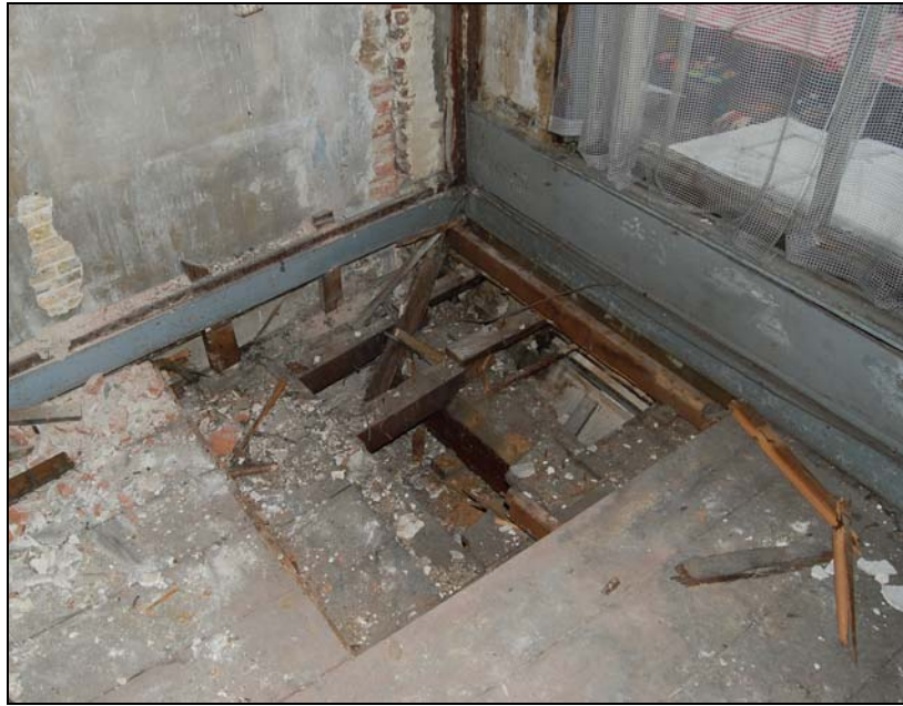
Deel van de balklaag van de tweede verdieping, vrijgelegd achter de voorgevel.