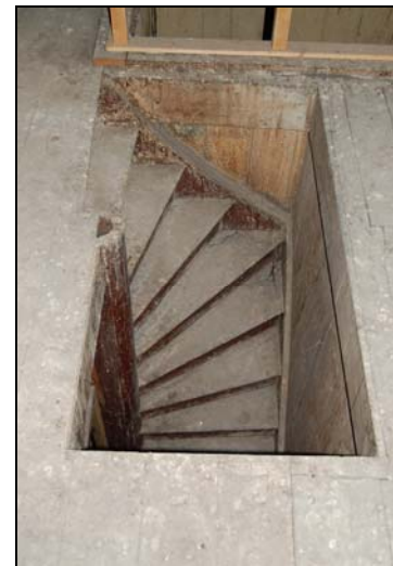
Links de binnenzijde van de oven, gefotografeerd vanuit de schoorsteen op zolderniveau. Rechts de spiltrap naar de zolder.