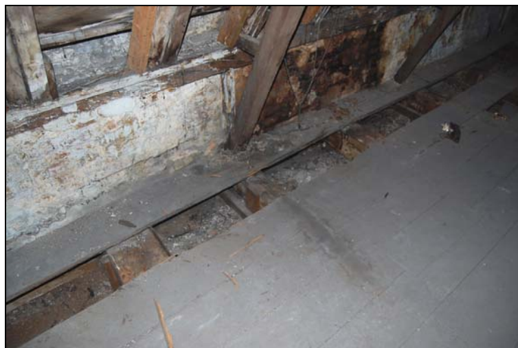
Zolderbalklaag van nummer 9, zichtbaar gemaakt langs de rechter bouwmuur.

De eiken zolderbalklaag is alternerend uitgevoerd, dat wil zeggen met afwisselend zware en lichtere balken. Waarschijnlijk was deze vloer op vergelijkbare wijze als de onderliggende vloer uitgevoerd, met moeren en kinderbalken. Als in de loop van de 17 de eeuw dit vloertype uit de mode geraakt kan de vloer met eenvoudige middelen gemoderniseerd worden door de kinderbinten op te nemen en te vervangen door tussenbalken die minder zwaar dan de oorspronkelijke moerbalken uitgevoerd hoeven te worden.