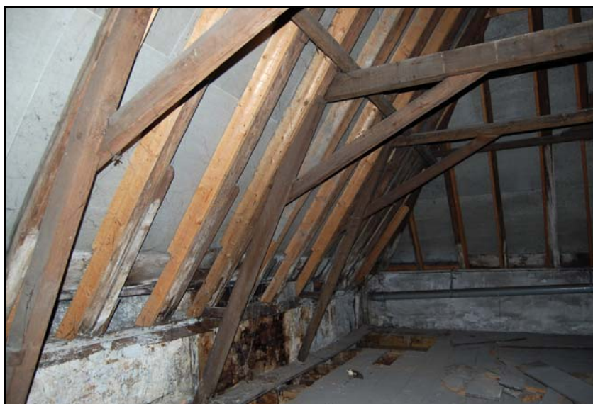
Overzicht van de kapconstructie met spanten met kreupele stijlen van nummer 9.

De muurplaat aan de rechter zijde is aan de onderzijde voorzien van enkele kepen. Mogelijk betreft het een secundair toegepaste moerbalk, die eerst in de lengterichting doorgezaagd is.