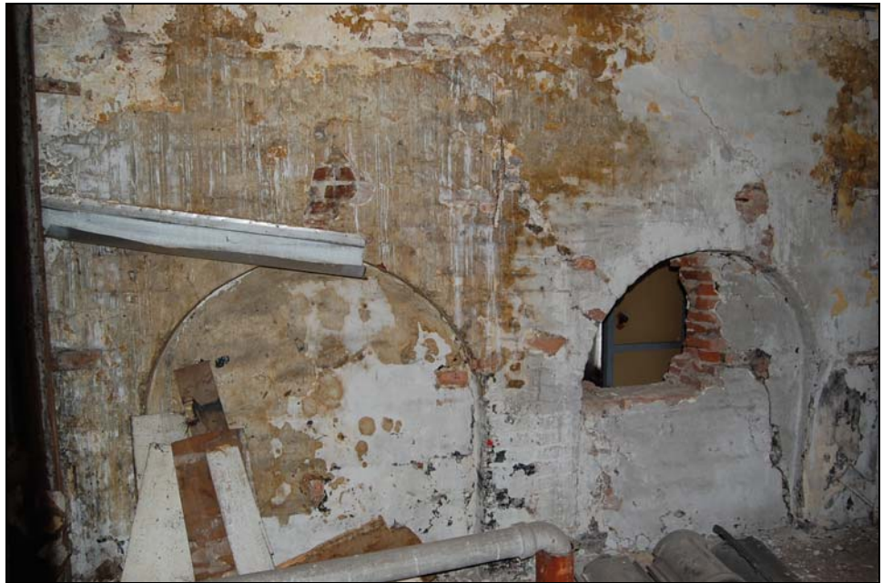
Gemeenschappelijke bouwmuur tussen nummer 7 en 9 op de tweede verdieping van nummer 7. Oorspronkelijk lag de zoldervloer een stuk lager.

aangetroffen bouwspoor van de oorspronkelijke zoldervloer op deze muur projecteren, dan loopt dit niveau nog net boven de twee bogen. De muur is opgetrokken met een 10-lagenmaat van 70 cm. Op de begane grond is de scheidingsmuur geheel uitgebroken.