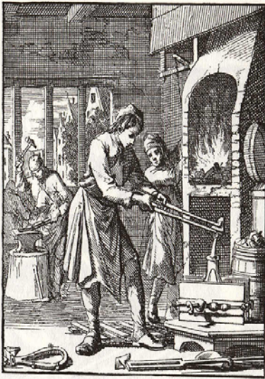
Een zilversmid aan het werk met rechts op de achtergrond een smidsvuur dat brandt in een voorziening die vergelijkbaar is met de in Melkmarkt 7 aangetroffen oven. Uit: Johannes en Caspaes Luiken, 100 Verbeeldingen van Ambachten, Amsterdam 1694.

hand dat de oven gebruikt is door zilversmeden die hier in het derde kwart van de 19 de eeuw als huurder bekend zijn. Zie hiervoor ook bijlage 1. Zilversmeden gebruiken een oven en vuur bij het vervaardigen van hun gietvormen, het weer zacht maken van door hameren gehard zilver en het smelten van metaal.