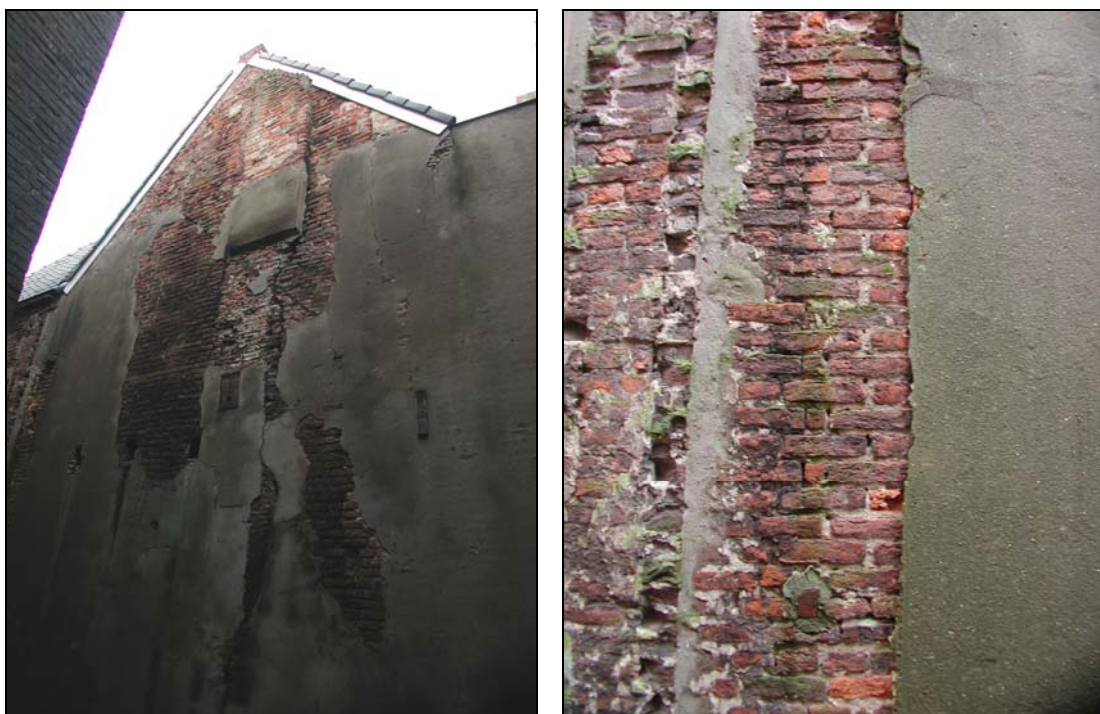
Achtergevel van nummer 7, rechts de linker aansluiting van het gevelmetselwerk met klezoren.