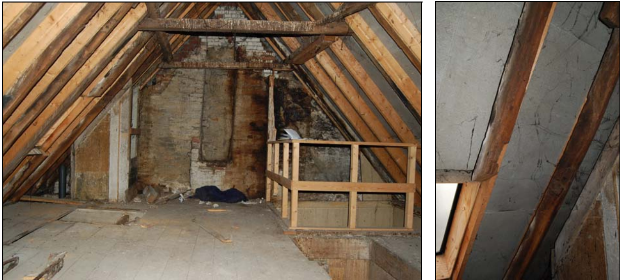
Overzicht van de zolder in de richting van de achtergevel. Rechts een detail van twee secundair verwerkte laat-middeleeuwse daksporen.