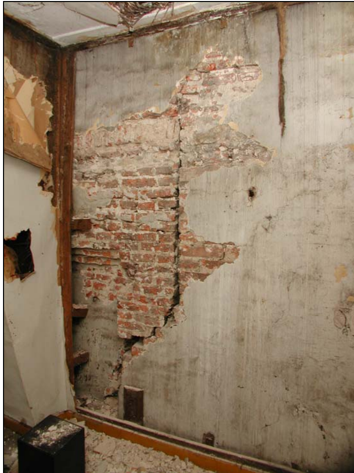
Deel van de linker bouwmuur van Melkmarkt 7 op de tweede verdieping.